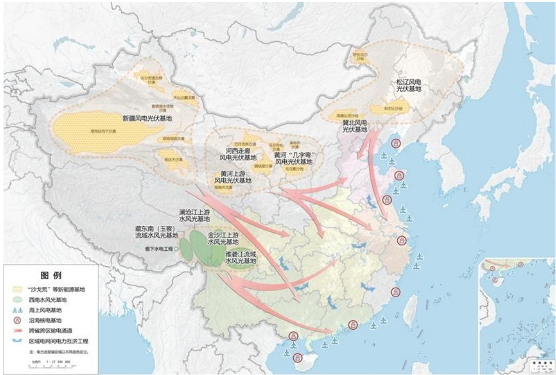
图 1 清洁能源基地布局示意图