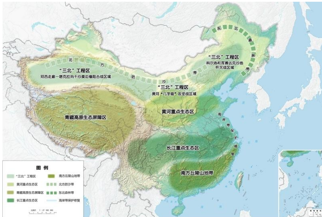
图 3 重要生态系统保护和修复重大工程布局图